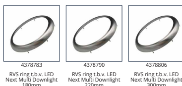
4378783 RVS ring t.b.v. LED Next Multi Downlight 180mm 4378790 RVS ring t.b.v. LED Next Multi Downlight 220mm 4378806 RVS ring t.b.v. LED Next Multi Downlight 300mm