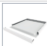
Opbouwset Wit 60x30:1000954 60x60:4607764 120x30:4607771