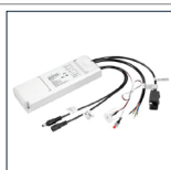
Noodmodule Kit 1000282