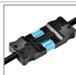
GST - Wieland snoeren Op aanvraag